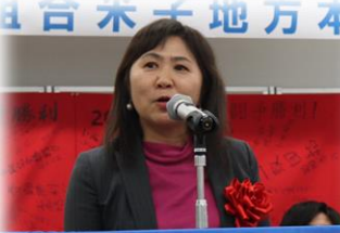
衆議院議員 推薦候補者 島根1区補欠選挙 亀井 亜紀子さま