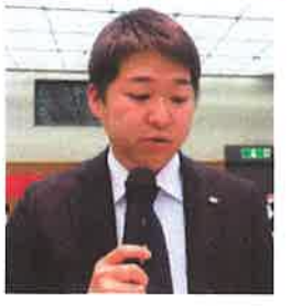
沖島 委員 (倉敷電気分会)

◆業務過多による技術力低下について◆実働要員不足について◆組合活動における動員回数について◆責任者手当について。