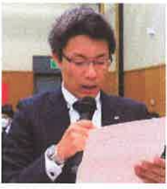
馬越 委員 (岡山運転区分会)

◆業務過多による技術力低下について◆実働要員不足について◆組合活動における動員回数について◆責任者手当について。