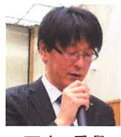
下山 委員 (運輸部会)

◆駅における今後の分会運営の在り方について◆駅無人化に伴う要員と業務課題、スケジュールについて。