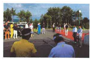
絶好のゴルフ日和でした！

冒頭、植田委員長より、安全確立について組織の継承について挨拶があった後、来賓を代表して大瀬委員長から、安全問題、二〇一八総合労働協約について、シニア・シニアリーダー、契約社員の制度について挨拶がありました。