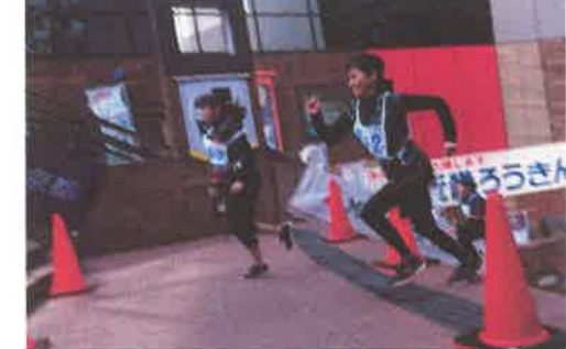
力強く駆け上がりました!!